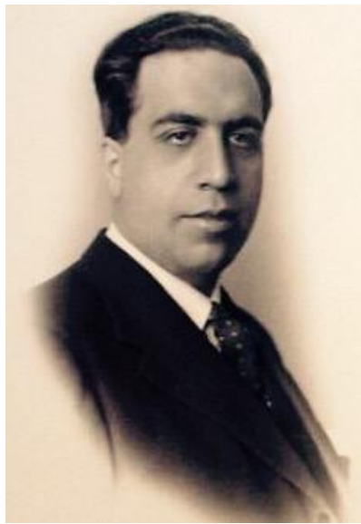
Diputado Sánchez-Guerra en 1923

Sin más demora que la indispensable para llevar a efecto los actos administrativos, el alférez Sánchez-Guerra, vistiendo de nuevo su uniforme color “garbanzo” propio de Regulares, en la noche del 4 de agosto de 1921, embarca en la madrileña estación de Atocha, en el correo-expreso de Málaga, llegando a la capital malacitana a la mañana siguiente (día 5) ,donde embarcaría por la noche en el vapor “Vicente de Roda”, que lo dejaría, en las primeras horas de la mañana del día 6 de agosto en el puerto de la antigua Rusadir fenicia. Se presenta de inmediato en la Representación del Grupo en Melilla, donde lo encuadran en el Tabor de Caballería, que manda el comandante de la misma Arma don Constantino Jiménez Goicochea, con el que pasa a formar parte de las Fuerzas Expedicionarias del Grupo que han acudido, junto al Tercio de Extranjeros y otras fuerzas peninsulares, y con la urgencia que el caso requería, en socorro de la ciudad melillense asediada por las belicosas tribus rifeñas de Abd-El-Krim. Ya en acciones de campaña, el día 7 de agosto, el alférez Sánchez-Guerra, recién nombrado Ayudante del Tabor de Caballería, asiste a los combates para la protección