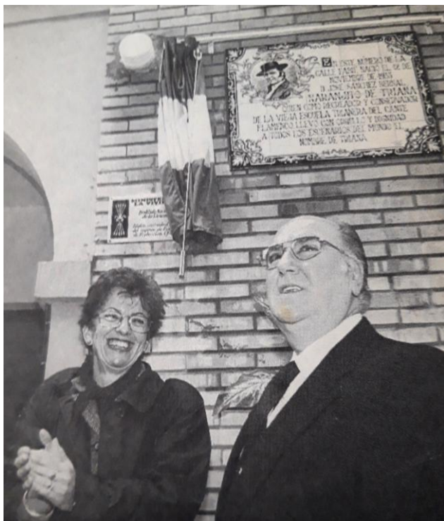
Placa en la casa donde nació

Premio Onda (1971), de la Cadena Ser, por la Misa Flamenca.