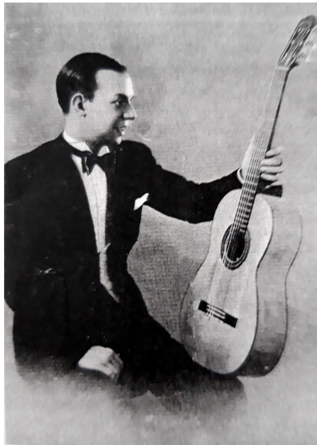
Sabicas en 1939

las circunstancias que fueran, sus primeras grabaciones no fueron realizadas en España, sino en Holanda y Nueva York (EEUU), con el acompañamiento musical del guitarrista navarro Agustín Castellano Campos, conocido artísticamente por Sabicas.