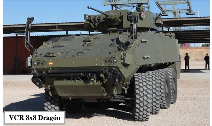
VCR 8x8 Dragón

NISSAN Patrol 6 CIL, Patrol MC 4 Guardia Real, ML 6, M 110 14/2, Retrocargadora Hidromek, Pathfinder R 51.