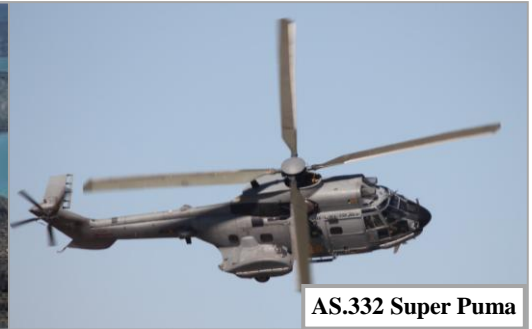
AS.332 Super Puma