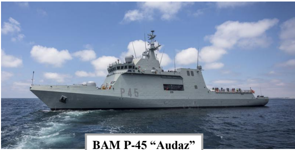
BAM P-45 "Audaz"