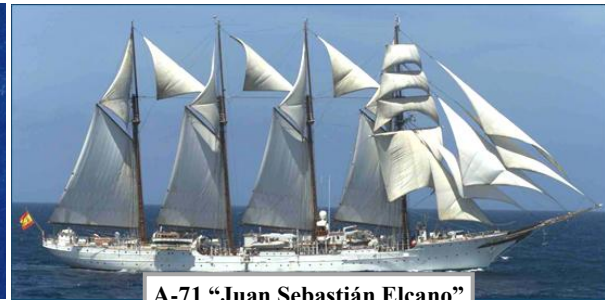
A-71 "Juan Sebastián Elcano"