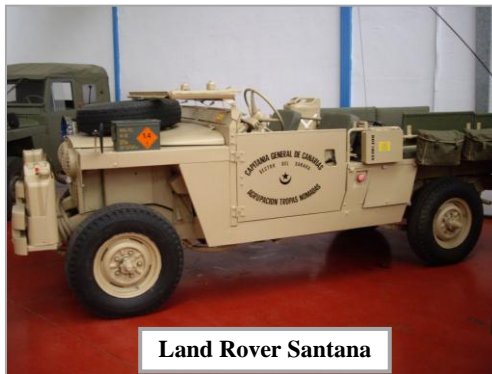
Land Rover Santana