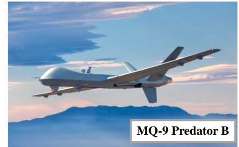
MQ-9 Predator B