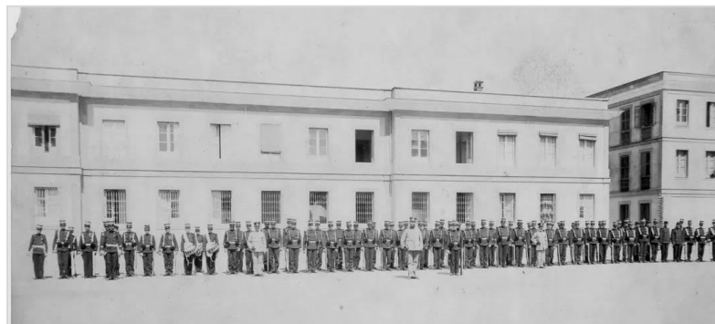
Cuartel de Zapadores-Ingenieros. Avda. de San Sebastián (Borbolla). 1910

1931 en la IIª República la unidad mengua a unidad tipo batallón como Batallón de Zapadores Minadores nº 2. Llegó a tener en la Guerra Civil hasta 23 compañías, pasando a ser regimiento ya en 1939. Sus compañías 4ª y 14ª ostentan la Medalla Militar Colectiva en sus banderines con motivo de la Guerra Civil, en 1939, transformándose pues el Batallón en Regimiento Mixto de Ingenieros nº 2.