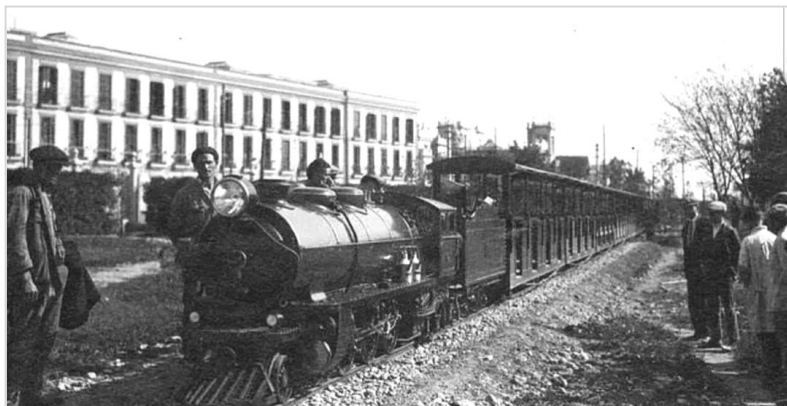
Cuartel de Ingenieros visto desde la estación base del tren Liliput. 1929