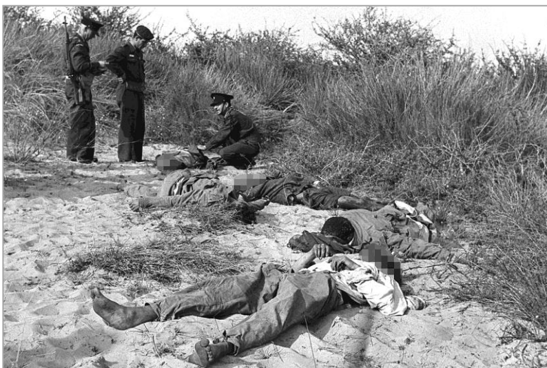
Policías israelíes inspeccionan los cuerpos de cinco fedayines abatidos cerca de Nir Galim, 1956.

Provocaron problemas políticos y de seguridad al Gobierno de Leví Eshkol . Los partidos de oposición israelíes atacaron a Eshkol y la coalición que presidía por su falta de respuesta adecuada a los movimientos de Al Fatah y a los ataques de la artillería siria al norte de Israel. No debemos olvidar que esos ataques sirios fueron provocados por Israel con sus movimientos dentro de las fronteras de El Golán, que era territorio de Siria.