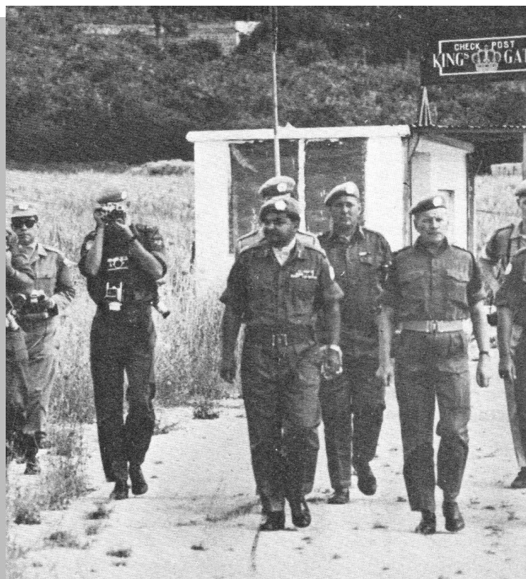
El general de división Rikhye, en el centro de la imagen, se retira con sus oficiales del puesto fronterizo King's Gate .

el general Rikhye al manifestar: “Creo que va a estallar una grave guerra en el Medio Oriente, y que dentro de 50 años todavía estaremos resolviéndola” .