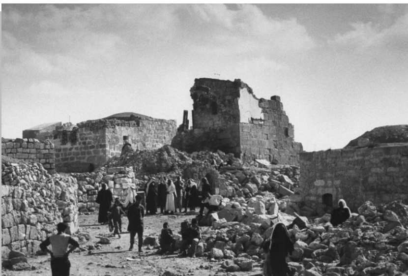
Casas demolidas en Samu, en el ataque israelí de noviembre de 1966.