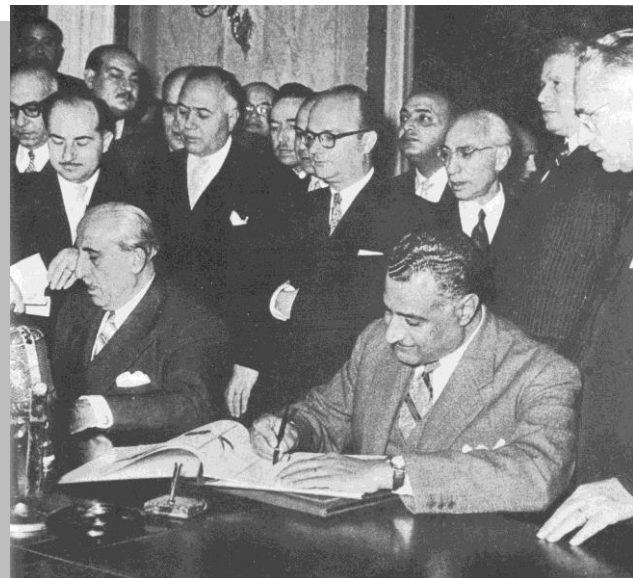
Los presidentes Nasser de Egipto (der.) y Shukry Kuwatly de Siria (izq.) firman la creación de la RAU. 1 febrero 1958.

La mayoría de las incursiones iniciales se realizaron desde la Franja de Gaza, aunque en 1956 Husein, el rey jordano, permitió algunas desde su territorio. La crisis del Canal de Suez que vimos en el artículo anterior (Nº 173 de AMARTE) supuso una disminución de la actividad guerrillera.