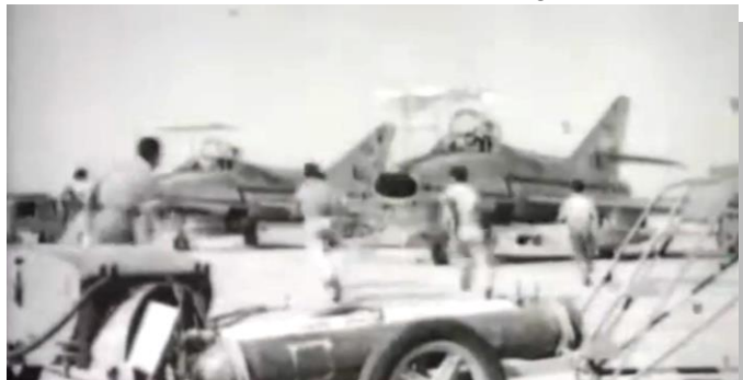
Pilotos y dotaciones de tierra israelíes corren hacia los Super Mystère B2, entrenando para la Operación “Moked”

Israel sentía como una amenaza los acuerdos entre los países árabes y no dudó en comenzar una guerra “preventiva” contra ellos. La lucha comenzó el 5 de junio de 1967 cuando Israel destruyó la mayor parte de la aviación egipcia con un ataque aéreo contra sus aeródromos. Lo mismo hizo contra las aviaciones de Jordania, Siria e Iraq. El ejército israelí mostró una gran superioridad frente a los ejércitos árabes y dejó patente una mayor capacitación técnica y humana. Expondré en primer lugar como fue esa operación aérea sorprendente y en el siguiente capítulo (que continuará en el próximo número de la revista AMARTE, el 175) resumiré la lucha en los tres frentes de la guerra.