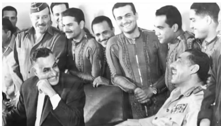
Un sonriente Nasser anuncia, junto al mariscal Amer y rodeado por pilotos egipcios, el cierre del estrecho de Tirán.

Finalmente, Nasser es informado por los soviéticos de que en realidad no hay tropas israelíes en la frontera con Siria. Sin embargo, el entusiasmo árabe se ha desbordado ante un posible ajuste de cuentas con el enemigo israelí. Para Nasser dar marcha atrás en su beligerancia sería interpretado como una debilidad que no puede permitirse. Sería defraudar a los árabes de Egipto, y también a los de otras naciones que lo veían desde la crisis de Suez